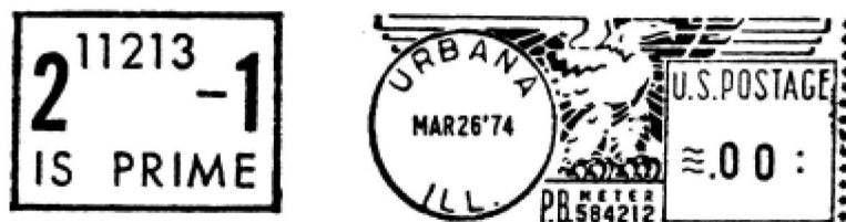
Slika 1.2. Poštanska marka

Razvojem modernih računala pronalazak većih Mersenneovih brojeva postao je lakši i uspješniji. 1952. godine otkriveno je pet novih Mersenneovih brojeva: M_{521} , M_{607} , M_{1279} , M_{2203} i M_{2281} . 1957. i 1961. godine otkriveni su M_{3217} , M_{4253} i M_{4423} . U sklopu Sveučilišta Illionis u Urbana - Champaignu 1963. godine pronađena su tri nova Mersenneova broja. Zanimljivo je da su se nakon otkrića ti brojevi u obliku žiga pojavljivali na poštanskoj markici grada Urbana. ( Slika 1.2. Poštanska marka )