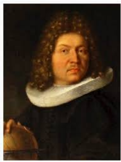
Jacob Bernoulli (1655. - 1705.)

Samo rješavanje diferencijalnih jednađbi zauzima pažnju znanstvenika od početka razvoja diferencijalnog računa do danas. Diferencijalne jednađbe prvog reda uspješno je rješavao švicarski matematičar Jacob Bernoulli (1655.-1705.). Jednu važnu i vrlo općenitu metodu za rješavanje diferencijalnih jednađbi uveo je francuski matematičar Joseph Lagrange (1736.-1813.).