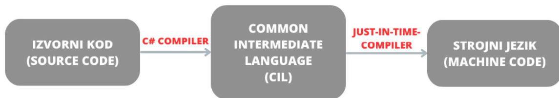
Slika 2.1: Prevođenje koda

Pri izgradnji aplikacije C# compiler prevodi izvorni kod u takozvani common intermediate language (CIL). Računalo ne može izvršavati CIL, on je zamišljen kao međukorak između izvornoga koda i strojnoga jezika. Za izvršavanje koda u .NET okruženju brine se takozvani common language runtime (CLR). CLR koristi just-in-time compiler kako bi preveo CIL u strojni jezik tijekom izvođenja programa.