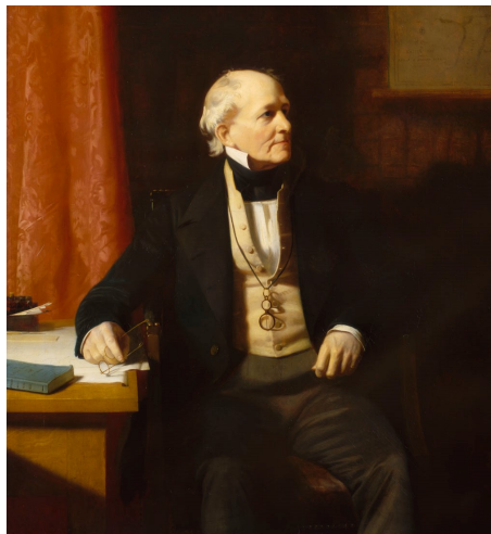
Slika 8: Sir Francis Beaufort 8

Beaufortova šifra bazirana je, prema [6] i [7], na Beaufortovom kvadratu vidljivom u Tablici 6 koji izgleda poput Vigenèrovog kvadrata ( Tablica 1 ) sa sljedećom bitnom razlikom: retci u Beaufortovom kvadratu su retci iz Vigenèrovog kvadrata ali je svaki redak napisan u obrnutom redoslijedu. Kao što su u Vigenèrovom kvadratu prvi redak i stupac identični onima koji služe kao indeksni redak i stupac (odnosno, “vanjski” redak i stupac kvadrata), tako su u Beaufortovom kvadratu to prvi redak i zadnji stupac. Koristeći Beaufortov kvadrat, šifriranje i dešifriranje svodi se na isti postupak preslikavanja kao i u Vigenèrovoj šifri: