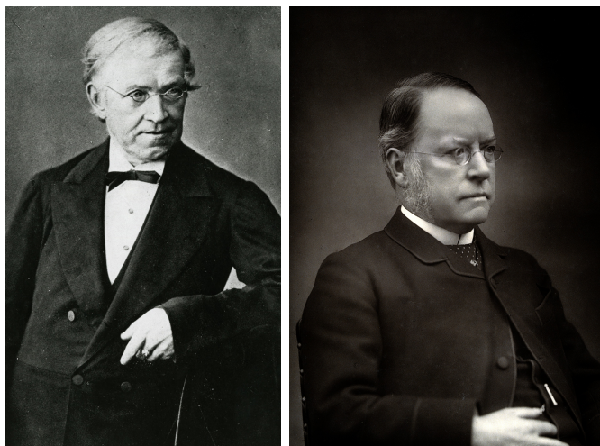
Slika 9: Sir Charles Wheatstone i Barun Lyon Playfair 9

Još jedan njegov izum bila je šifra u telegrafiji koja nosi ime njegovog prijatelja baruna Lyon Playfaira od St. Andrews. Playfair je bio znanstvenik i javna ličnost Viktorijanskog doba u Engleskoj. Prema [4], na večeri u siječnju 1854. godine kojoj su prisustvovali princ Albert, muž kraljice Ujedinjenog Kraljevstva Viktorije i tadašnji državni tajnik te budući premijer Lord Palmerston, a čiji je domaćin bio predsjednik vladajućeg vijeća Lord Granville, Playfair je demonstrirao nešto što je nazočnima predstavio kao “Wheatstonova novootkrivena simetrična šifra”. Nekoliko dana kasnije kada je Playfair bio u Dublinu primio je dva kratka pisma od Palmerstona i Granvilla u kojima su se nalazili šifratu dobiveni koristeći objašnjeni im sustav, što je pokazalo da su ga obojica brzo svladala.