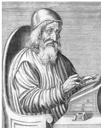
Slika 5: Johannes Trithemius 5

Polialfabetne substitucijske šifre doživjele su sljedeći pozitivan korak pojavom prve tiskane knjige o kriptologiji kao dio skupa radova nazvanih Polygraphiae libri sex, Ioannis Trithemii abbatis Peapolitani, quondam Spanheimensis, ad Maximilianum Caesarem koju je napisao jedan od najpoznatijih intelektualaca svojeg vremena, Johannes Trithemius, njemački benediktinski redovnik. Knjigu je napisao 1508. godine, a tiskana je 1518. godine nakon njegove smrti. Prema [4], bavio se alkemijom i magijom što je doprinijelo tome da postane jedna od najpoznatijih osoba u okultnim znanostima, dok je zbog svog značajnijeg (konkretnijeg) znanstvenog rada – u područjima povijesti, teologije i kriptografije – dobio nadimak “otac bibliografije”.