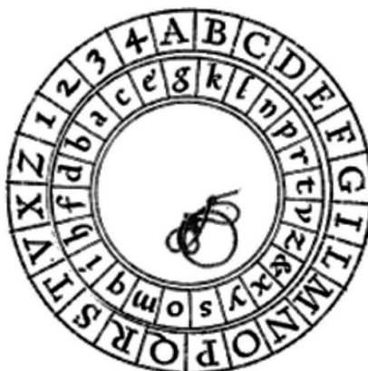
Slika 2: Albertijev disk za šifriranje 2

od diskova podijeljen je na 24 jednake ćelije. S vanjske strane vanjskog diska bila su popisana velika slova latinskog pisma, odnosno engleske abecede izuzev slova J, U, W, H, K i Y. Alberti je smatrao da su navedena slova nepotrebna (jer se u latinskom jeziku nisu puno koristila) ili da se mogu zamijeniti drugim slovima. Osim slova abecede, tamo su se nalazili i brojevi od 1 do 4 koji bi se koristili zajedno s knjigom u kojoj su bile zapisane ranije definirane fraze (njih 336) koje su se preslikavale na četveroznamenkaste kombinacije tih brojeva. Ovi brojevi mogu se koristiti i kao upute za rotiranje diska tijekom postupka šifriranja kako je opisano u drugoj metodi šifriranja u nastavku ovog potpoglavlja. Unutarnji disk sadržavao je mala slova latinskog pisma, odnosno engleske abecede u nasumičnom poretku izuzev slova u, w i j, ali uključujući et (što se vjerojatno odnosilo na znak &). Ovakva naprava naziva se Albertijev disk za šifriranje te je vidljiva na Slici 2 .