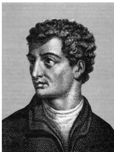
Slika 1: Leon Battista Alberti 1

Leon Battista Alberti, vanbračno dijete talijanskog plemića (nije poznato tko mu je majka), rođen je 1404. godine u Genovi. Razvio je metodu šifriranja koja je donijela revoluciju u područje kriptografije na zapadu. Albertijeva šifra, opisana u njegovoj raspravi o šifriranju De Cifris 1467. godine, prva je polialfabetna šifra. Raspravu je napisao za prijatelja Leonarda Datija ali ona nije bila tiskana u 15. stoljeću.