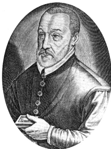
Slika 7: Blaise de Vigenère 7

definirao Bellaso, zbog čega mu se ona kasnije pogrešno pripisala.