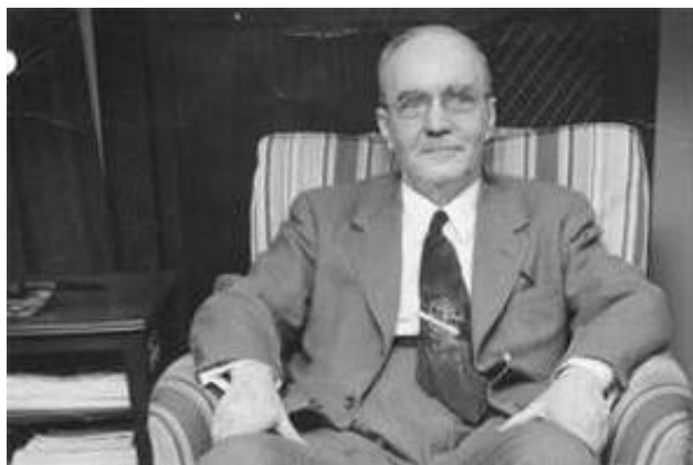
Slika 10: Lester S. Hill 11

poruka se nadopunjuje da bi se mogla podijeliti u blokove od po m slova. Bila je to prva praktična poligramska šifra koja je mogla šifrirati više od tri slova odjednom.