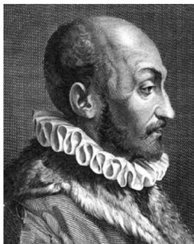
Slika 6: Giovan Battista Bellaso 6

Kako je već navedeno u Potpoglavljima 1.1 i 1.2 , prva dva značajna koraka za polialfabetne šifre napravili su Alberti i Trithemius koji su bili vrlo poznati. Sljedeći značajan korak napravio je čovjek koji nije ostavio puno traga iza sebe, talijan Giovan Battista Bellaso. Zna se da je rođen u Bresciani 1505. godine u plemićkoj obitelji, te da je 1553. godine izdao knjižicu pod nazivom La Cifra del Sig. Giovan Battista Bellaso .