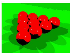
Slika 3.2: Oblik loptica u biljaru

Ako ste ikad bili na kuglanju ili biljaru mogli ste primjetiti da broj čunjeva odnosno loptica odgovara trokutastim brojevima. Uz to, trokutasti brojevi se često koriste i u konstruiranju i gradnji raznih građevina kako bi se osigurala stabilnost ali i vizualna ljepota.