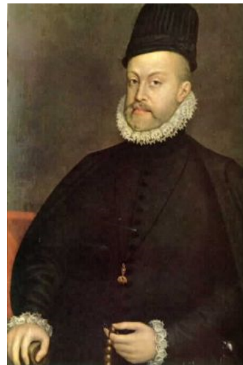
(b) Blaise de Vigenère