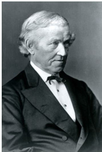
(a) Charles Wheatstone