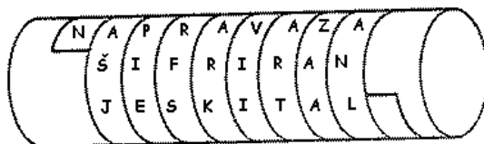
Slika 1: Skital

Početak kriptografije nije točno utvrđen, ali se smatra da je počela više od 2000 godina pr. Kr. jer iz tog vremena potječu prvi pronađeni tragovi šifriranja. Točnije, oko 1900. godine pr. Kr. u Egiptu je nastao natpis koji se danas smatra prvim dokumentiranim primjerom pisane kriptografije. Stari Grci su također pridonijeli razvoju kriptografije; Spartanci su u 5. stoljeću pr. Kr. upotrebljavali napravu za šifriranje zvanu skital . Skital je bio drveni štapić oko kojeg se namotavala vrpca od pergamenta pa se na nju okomito pisala poruka. Nakon upisivanja poruke, vrpca bi se odmotala, a na njoj bi ostali izmiješani znakovi koje je mogao pročitati samo onaj tko je imao štapić jednake debljine.