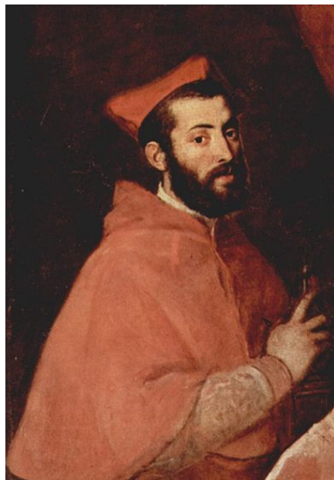
(a) Giovan Battista Bellaso