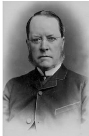
(b) Lyon Playfair