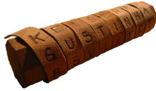
SLIKA 1. Skital