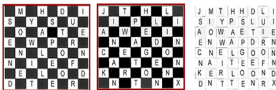
SLIKA 3. Šifriranje pomoću Trellis šifre

Ovaj oblik slanja skrivenih poruka koristili su Englezi u 16. stoljeću. Špijun kraljice Elizabete I, sir Francis Walsingham (1530–1590), koristio je rešetke u komunikaciji sa svojim agentima. Trellis , odnosno rešetke, predstavljaju oblik transpozicije u obliku šahovnice koji podsjeća na Rail-fence šifru. Primjerice, otvoreni tekst Send money with all speed to our friend Jack in Antwerp at the Golden Lion Inn x , pomoću trellis šifre šifriramo na sljedeći način: Slova najprije upisujemo u bijela polja na šahovnici (u slučaju da se slova otvorenog teksta upisuju okomito, šifrat se čita vodoravno i obrnuto.) Nakon što se ispune 32 polja, prelazi se na crna polja (u slučaju da poruka ima manje od 64 slova, prazna polja se ispunjuju znakom X ili nulom). U slučaju ako bude više od 64 slova, potreban je još jedan papir (još jedna šahovnica) (Slika 3).