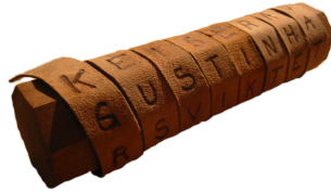
SLIKA 1. Skital