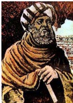
Slika 3.1. Thabit ibn Qurra (836. - 901.)

Prvo eksplicitno pravilo za pronalaženje određenih prijateljskih brojeva priznaje se arapskom matematičaru devetog stoljeća, Thabit ibn Qurrau. Osim što se bavio matematikom, Thabit ibn Qurrau bio je fizičar, astronom i prevoditelj. Pravilo za pronalazak prijateljskih brojeva njegov je najveći doprinos u matematici.