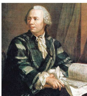
Slika 2.2. Leonhard Euler (1707. - 1783.)

Švicarski matematičar, fizičar i astronom Leonhard Euler, 1732. godine je proširio Fermatovo istraživanje i tvrdio da ako su n = 4k - 1 i 8k - 1 prosti, tada je 8k - 1 faktor od 2^n - 1 . Taj rezultat iskoristio je kako bi dokazao da je 2^n - 1 složen za n = 11, 23, 83, 131, 179, 191 i 239 , te kako bi pronašao djelitelje od 2^n - 1 za n = 29, 37, 43, 47 i 73 . Formalni dokaz ovih tvrdnji dao je Lagrange 1775. godine.