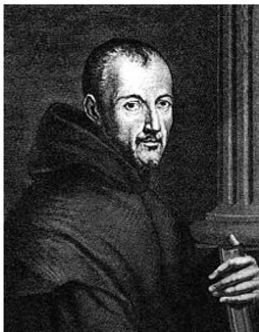
Slika 1: Marin Mersenne (1588.–1648.)

Najranija poznata redovita okupljanja matematičara su ona koja je organizirao redovnik Marin Mersenne (1588.–1648.), matematičar i fizičar. Mersenneov značaj za matematiku je prije svega u njegovoj korespondenciji sa svim važnim matematičarima toga doba, čime je omogućena razmjena ideja u doba u koje još nisu postojali matematički znanstveni časopisi niti brzi načini komunikacije. Kao čovjek koji nije puno pridonio novim saznanjima, Mer-