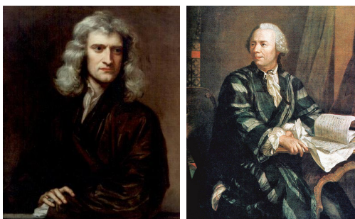
Slika 1: Isaac Newton i Leonhard Euler

Numerička matematika je disciplina koja proučava i numerički rješava matematičke probleme koji se javljaju u znanosti, tehnici, gospodarstvu, itd. U povijesnom razvoju začetaka numeričke matematike doprinijeli su Isaac Newton i Gottfried Wilhelm Leibniz u području prirodnih znanosti, a velike teorijske doprinose dali su Leonhard Euler, Joseph Louis de Lagrange, Carl Friedrich Gauss i dr. John Napier stvorio je logaritme kojima se množenje i dijeljenje moglo zamijeniti jednostavnijim zbrajanjem i oduzimanjem, a Charles Babbage izradio je prvo mehaničko računalo. Od sredine XX. stoljeća dostupnost elektroničkih računala dovela je do povećanja uporabe numeričkih matematičkih modela u znanosti, tehnici i ekonomiji.