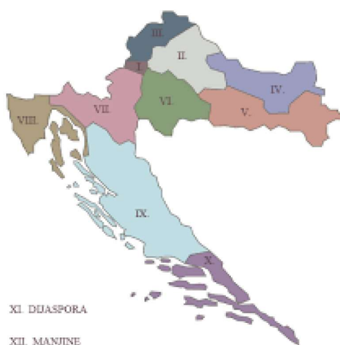
Slika 1: Izborne jedinice u RH