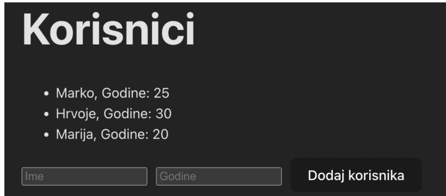
Slika 3.2: Dodavanje novog korisnika

Ovdje također možemo vidjeti princip odvojene odgovornosti gdje komponenta za dodavanje novog korisnika ne brine o tome kako izgleda lista niti kako se informacije dodaju u listu - ona samo brine o slanju i spremanju informacija novog korisnika.